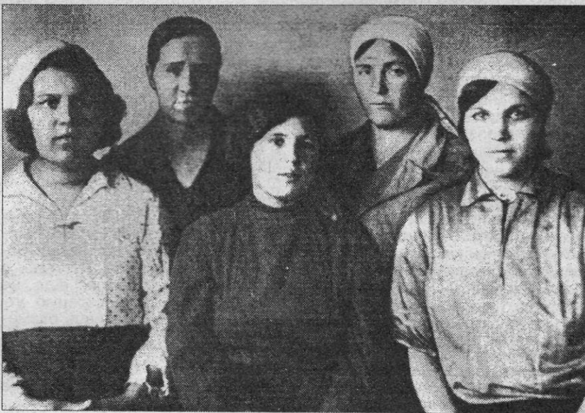
Группа первых строителей завода.

По материалам книги «Полвека на службе электрификации страны» (М., 1988 г.) и воспоминаниям старожилов.